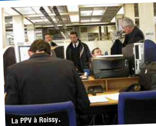
La PPV à Roissy.

23 février : les cinq colis – plus un fauteuil roulant – quittent Orly pour CDG où ils sont entreposés dans le local qu'Air France met à notre disposition, dans les sous-sols de la base PN.