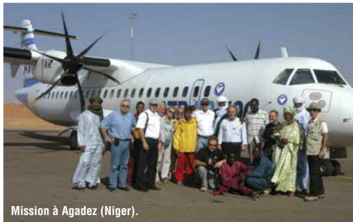
Mission à Agadez (Niger).