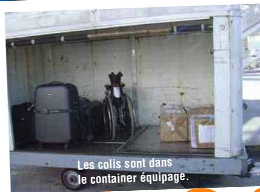
Les colis sont dans le container équipage.