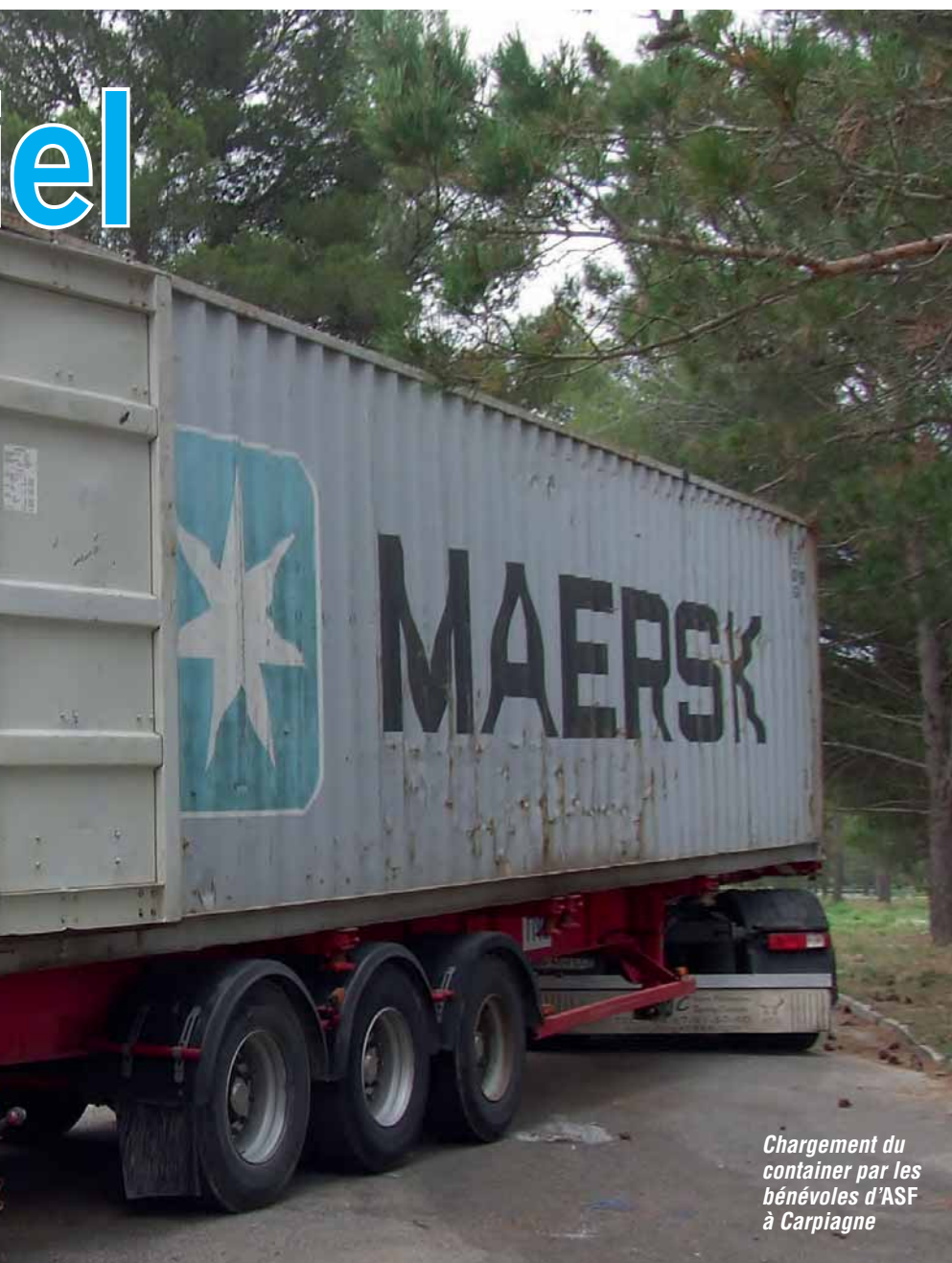
Chargement du container par les bénévoles d'ASF à Carpiagne