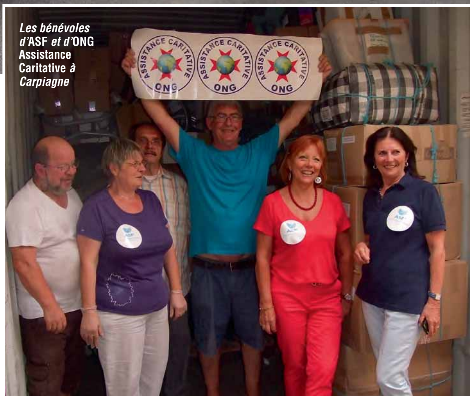
Les bénévoles d'ASF et d'ONG Assistance Caritative à Carpiagne